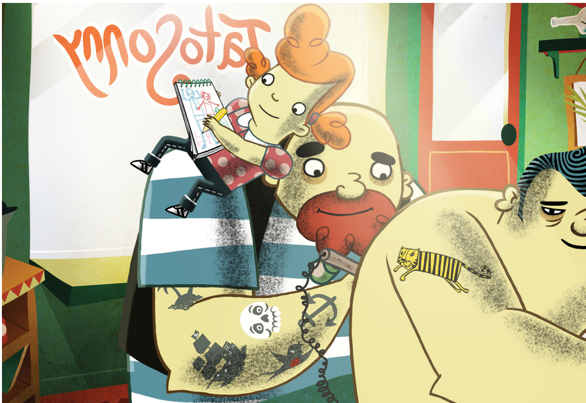
Ur filmen Tigrar och tatueringar

Kulturhuset Stadsteatern arrangerar också teater och scenkonst för barn och unga under skoltid och den planerade skolbion ses som en förlängning av denna verksamhet. Reguljära skolbiovisningar startar under våren 2018.