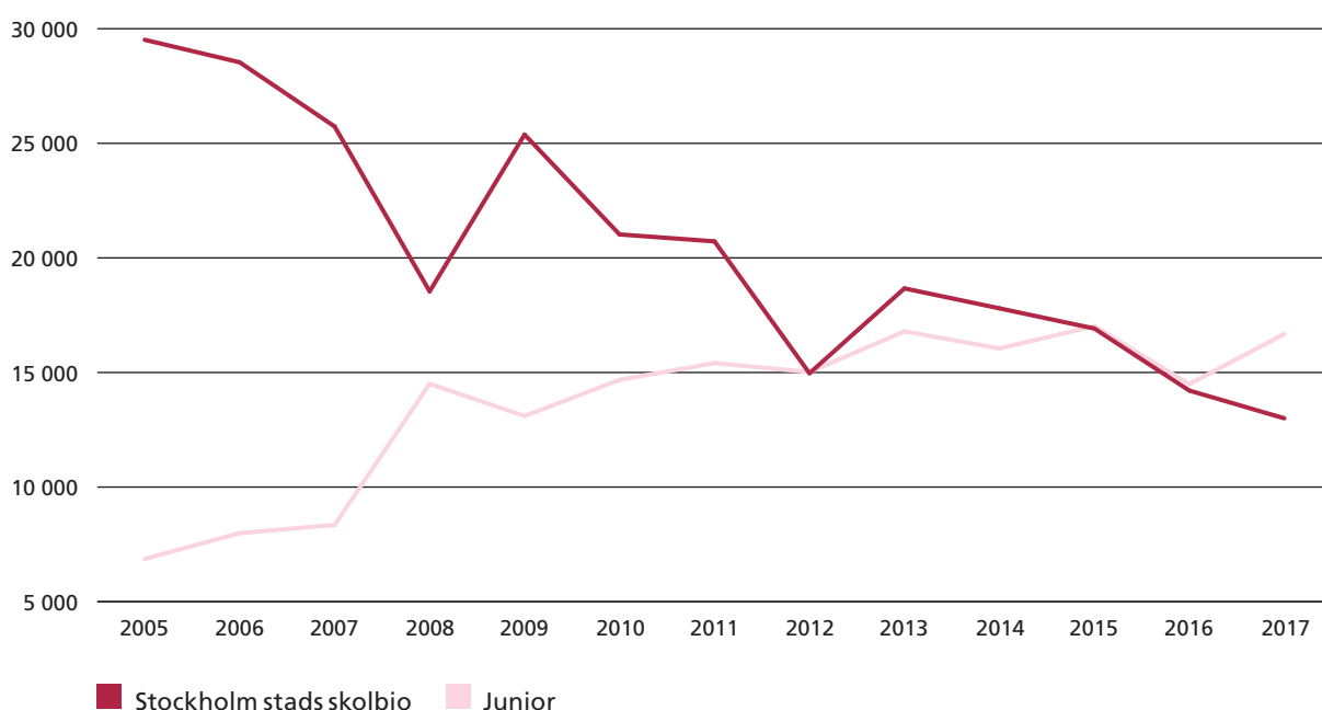
Stockholm stads skolbio jämfört med Juniorfestivalens utveckling 2005–2017

En jämförelse mellan verksamheterna visar att Stockholm stads skolbio också har minskat varje år parallellt med att Juniorfestivalen har växt. Det finns dock fler faktorer som har påverkat Stockholm stads skolbios minskade verksamhet. Bland annat fick skolbion minskad budget 2014 vilket innebar färre visningar och högre biljettpris.