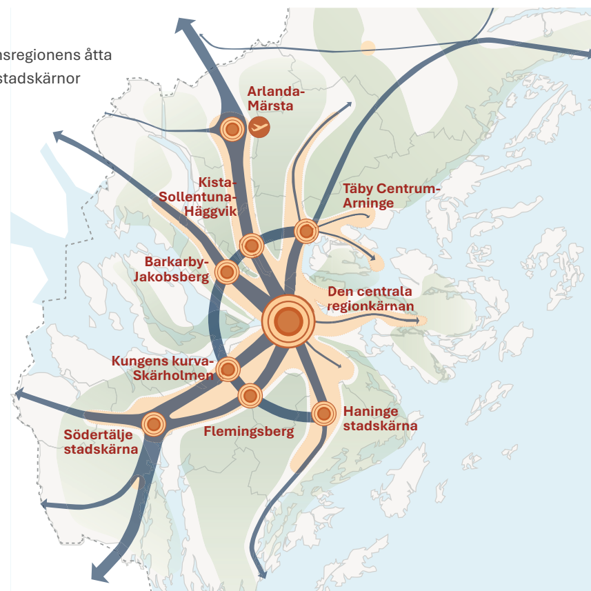
Stockholmsregionens åtta regionala stadskärnor

De regionala stadskärnorna är målpunkter för ett större regionalt omland och flera av dem har även ett storregionalt upptagningsområde och ingår i ett övergripande stadsnätverk i östra Mellansverige. De är alla olika i sin storlek och karaktär, och utvecklingen behöver därför utgå ifrån varje kärnas unika förutsättningar och karaktärer.