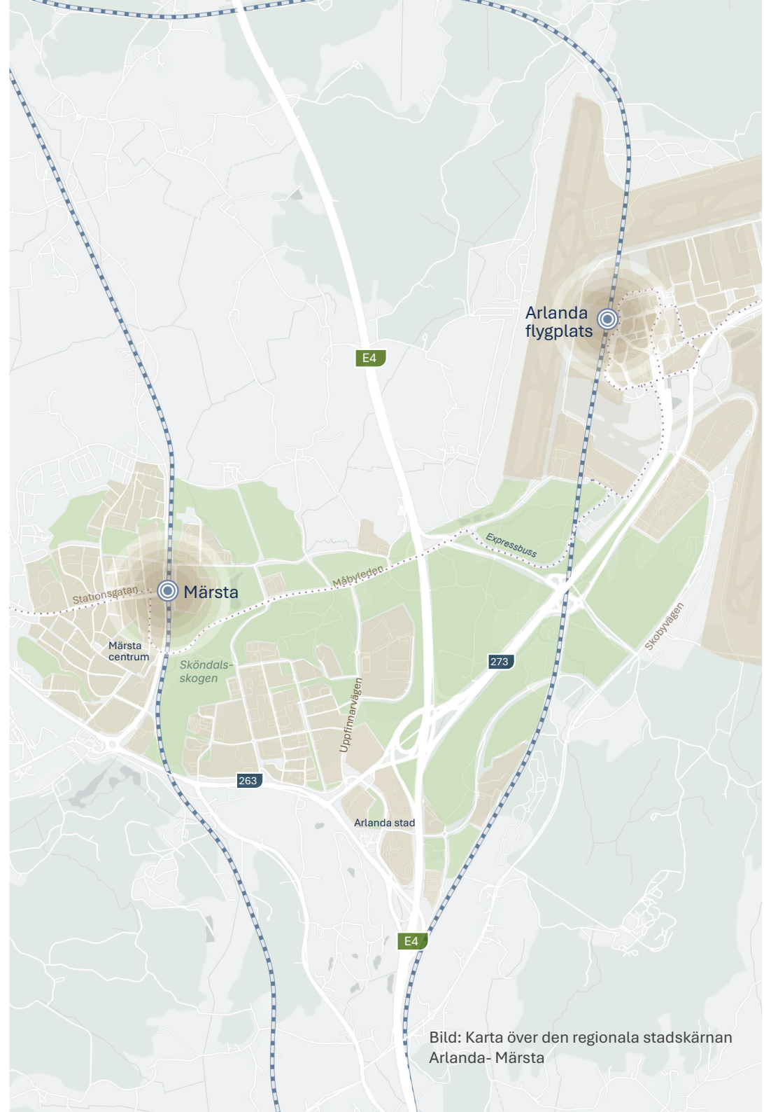
Bild: Karta över den regionala stadskärnan Arlanda- Märsta

Visionen för den framtida utvecklingen av stadskärnan är att fläta samman Arlanda och Märsta genom ett aktivt och inbjudande stråk. Öster om Märsta station planeras en helt ny stadsdel att växa fram med en blandning av bostäder, arbetsplatser och service i kollektivtrafiknära läge. Det finns också potential att knyta ihop omgivningens kulturlandskap med den framväxande bebyggelsen så att dagens besökare kan ta del av det genom promenadstråk och skyltning. Gällande översiktsplan stödjer även en utveckling runt Arlanda flygplats mot en flygplatsstad med nya kvarter för bland annat kontor, handel och hotell. Denna kombination är en stark grund för att vidareutveckla området som en dynamisk och hållbar regional stadskärna med internationell betydelse, i enlighet med kommunens beslutade Programförklaring för den regionala stadskärnan.