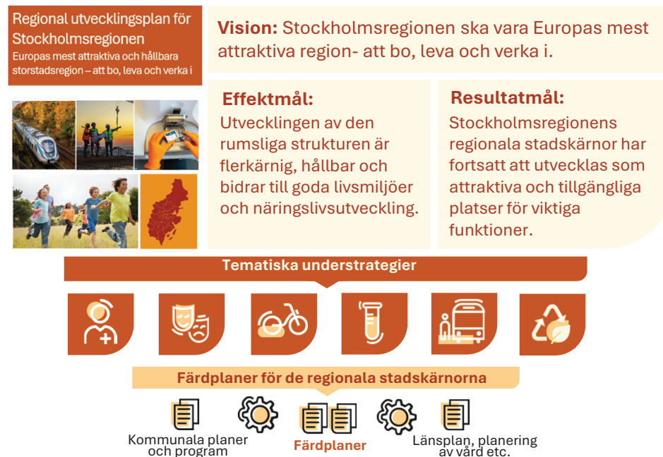
Bild: Färdplanernas förhållande till den regionala utvecklingsplanen och dess understrategier samt till andra planer och processer.

Flera frågor som har betydelse för att utveckla de regionala stadskärnorna hanteras inom ramen för andra lagstadgade processer, som till exempel planering och investering i infrastruktur och kollektivtrafik, planering av vård samt planering och genomförande kopplat till kommunala planer och program. Kring dessa frågor kan färdplanerna verka facilliterande och kraftsamlande.