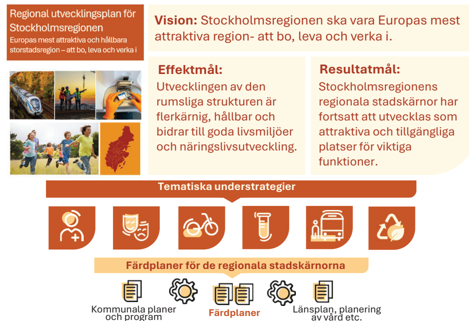
Bild: Färdplanernas förhållande till den regionala utvecklingsplanen och dess understrategier samt till andra planer och processer.

Flera frågor som har betydelse för att utveckla de regionala stadskärnorna hanteras inom ramen för andra lagstadgade processer, som till exempel planering och investering i infrastruktur och kollektivtrafik, planering av vård samt planering och genomförande kopplat till kommunala planer och program. Kring dessa frågor kan färdplanerna verka facilliterande och kraftsamlande.