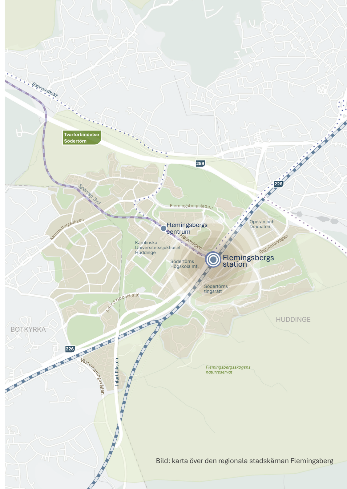
Bild: karta över den regionala stadskärnan Flemingsberg

I den regionala stadskärnan Flemingsberg pågår i dag en spännande utveckling från förort till regional stadskärna, där Flemingsberg även växer som bytespunkt i regionen. I hjärtat av Flemingsberg planeras ett nytt stadscentrum med nya kvarter, gator, torg och parker med urbana kvaliteter. Stadsutvecklingen kommer att länka samman kärnan på ett nytt sätt och skapa en attraktiv och levande mötesplats för såväl boende som verksamma och besökare i den regionala stadskärnan. Visionen för Flemingsberg är att vara en plats där kunskap och kreativitet möts i södra Stockholmsregionen.