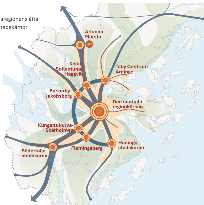
Stockholmsregionens åtta regionala stadskärnor

De regionala stadskärnorna är målpunkter för ett större regionalt omland och flera av dem har även ett storregionalt upptagningsområde och ingår i ett övergripande stadsnätverk i östra Mellansverige. De är alla olika i sin storlek och karaktär, och utvecklingen behöver därför utgå ifrån varje kärnas unika förutsättningar och karaktärer.