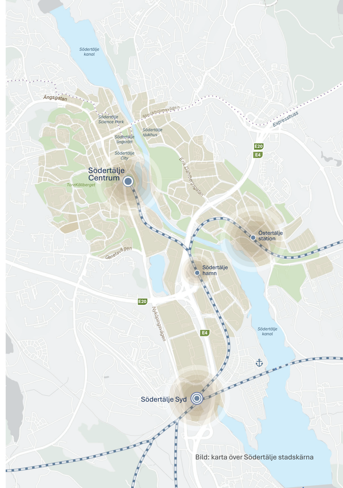
Bild: karta över Södertälje stadskärna

Under det senaste decenniet har Södertälje stadskärna vuxit norrut mot Södertälje Science Park. Arbetet med att utveckla stadskärnan har varit framgångsrikt och resulterade i att Södertälje vann pris som årets stadskärna år 2024. I det fortsatta utvecklingsarbetet planerar kommunen att förtäta och utveckla miljöerna runt kärnans spårstationer och på sikt planeras även den östra delen av kärnan att utvecklas, inklusive området runt Södertälje sjukhus. Utvecklingen kommer att fortsätta stärka Södertäljes roll som en viktig mötesplats i regionen, för såväl människor, näringsliv och kommunikationer.